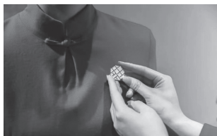
沈阳故宫咖啡馆设计