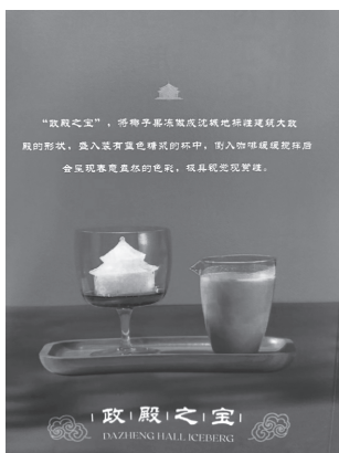
“莊啡”四款特色网红饮品