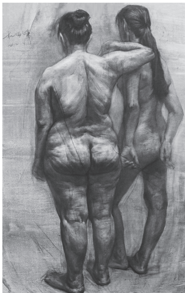
《双人体》 纸本 108cm × 78cm