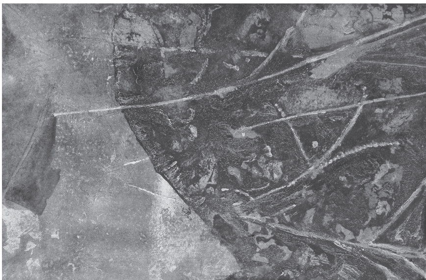
《峥嵘盛放》 岩彩画 80cm × 120cm

作品入选广州美术学院油画系第二工作室作品集《本相·3》，并由湖南美术出版社出版发行。