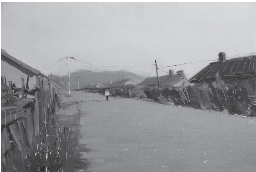
《北秋》 油画 80cm × 120cm