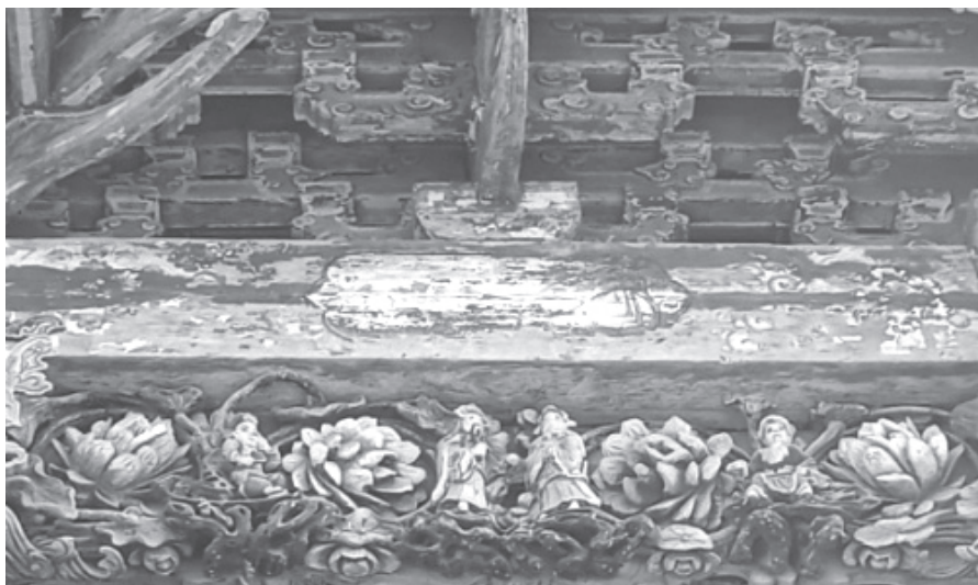
孝子故事额枋系列

由山西、陕西两省商人创建的山陕会馆，现作为全国重点文物保护单位，整个建筑突出了山、陕两省的地方建筑风格。