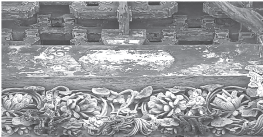
孝子故事额枋系列

当初不仅砖、瓦、木、石来自山、陕两省，就连五大工匠也由山、陕两省千里迢迢来到聊城，正如山、陕两省商人捐资筹建山陕会馆时说的“如处秦山晋水之间的那样，或许要的就是这种纯正的家乡味儿吧。”正是这样，山陕会馆以其独特的建筑艺术及其精美绝伦的雕刻艺术魅力，吸引着八方来宾，使游客扼腕赞叹、流连忘返。