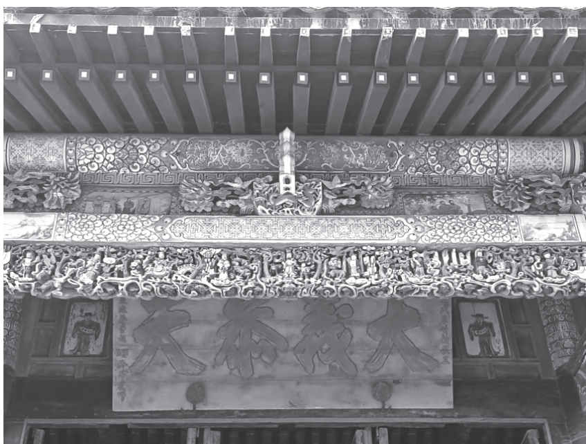
孝子故事额枋系列