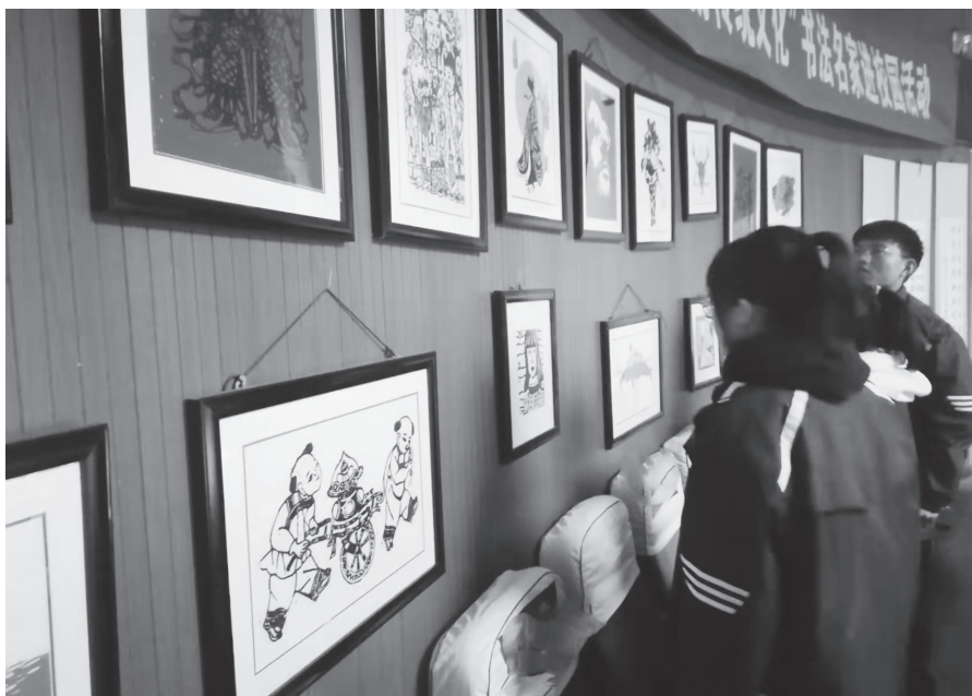
学生正在参观优秀版画及装饰画作品

课上在老师的指导下进行创作,评出优秀的线描画进行展示,同时,请出学生分享自己创作的心得体会,鼓励学生继续努力。这一阶段主要是培养学生造型的能力,